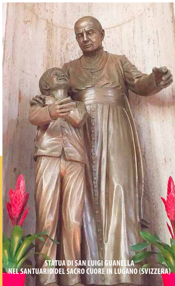
STATUA DI SAN LUIGI GUANELLA NEL SANTUARIO DEL SACRO CUORE IN LUGANO (SVIZZERA)

«Collaborare con Dio dovrebbe essere il programma della nostra vita. Ed è il programma dei Santi. [--] Lodiamo dunque Iddio nel suo servo il Beato Luigi Guanella; e preghiamolo che per l'intercessione di questo campione della fede e della carità ci dia grazia di imitarlo e tutti così ci benedica.»