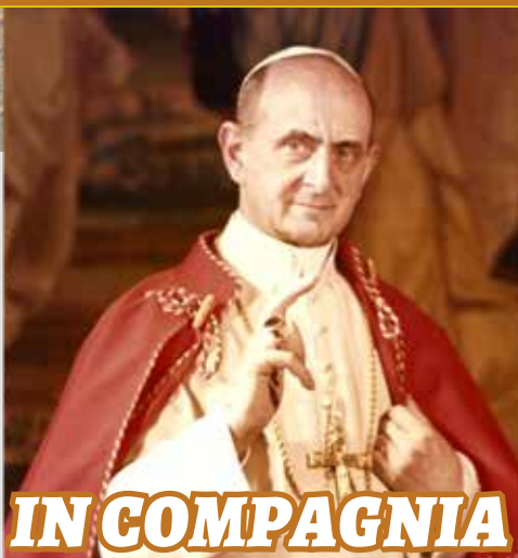
Papa Paolo VI